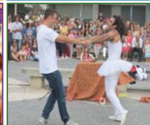
Mc Fois Comedy