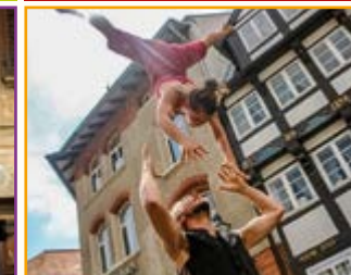
The Four String Company Tanz + Akrobatik