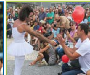
Mc Fois Comedy