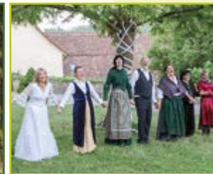
Theaterprojekt Zukunft Gegen den Strom